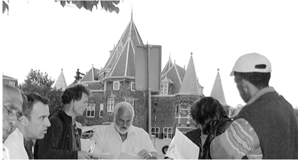
Meeting Point vergadering op de Nieuwmarkt