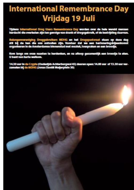
Poster International Remembrance Day 2013

Exposities: De vier panelen voor de ramen van het kantoor van de MDHG lenen zich goed voor kunstexposities. Addo fleurde de op met schilderijen van verboden natuurproducten die bij onze leden geliefd zijn: papaver, de cocoplant, cannabisplanten en paddenstoelen. De expositie werd feestelijk geopend.