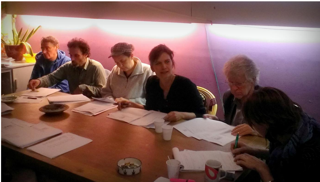
(Een deel van) Het nieuwe bestuur tijdens de ALV