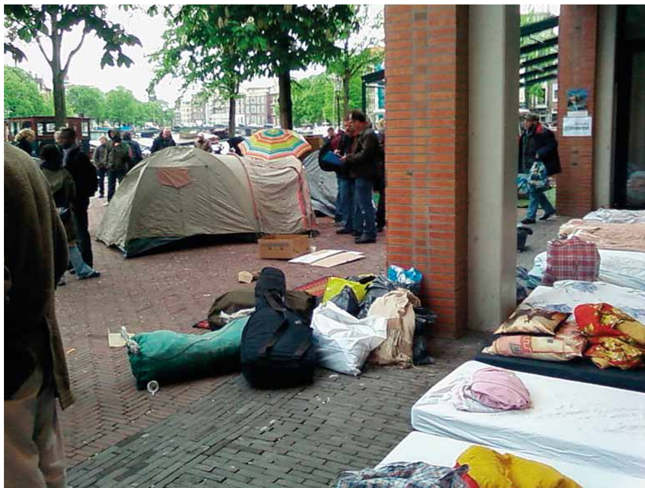
(Z)onderdak - protestactie bij de Stopera.