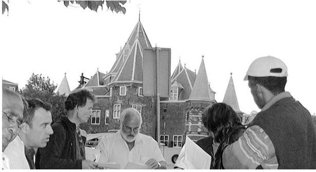
Meeting Point vergadering op de Nieuwmarkt